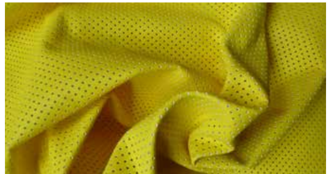
MARMARA DERI (TR)