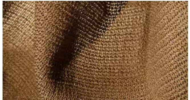
LANIFICIO EGIDIO FERLA (IT)