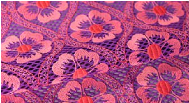
RICAMIFICIO GIMAR (IT)