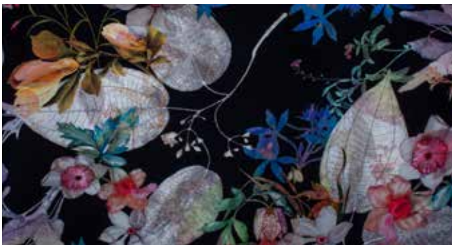
F.T.F. - FRANCE TEXTILE FABRICATION (FR)