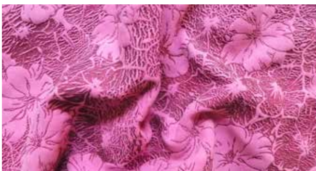
TANNERY ARENA ANGELO (IT)